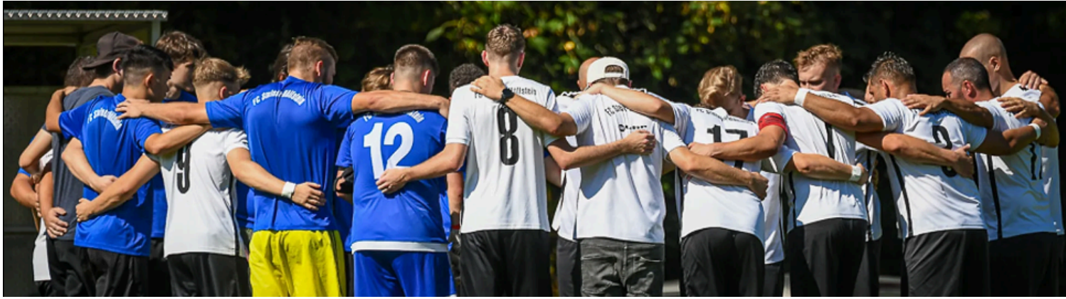
Ein Team, eine Mannschaft, alle zusammen zum Erfolg! Danke an FUPA Quelle aus der BZ vom Spiel in Eichsel.